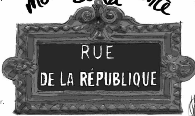
PROMENADE ARCHITECTURALE DERRIÈRE NICOLAS MÉMAIN ORGANISÉE PAR VENTILLO ET ILLUSTRÉE PAR RENAUD POULARD, SUR UNE PROPOSITION D'ALEXANDRE FIELD.