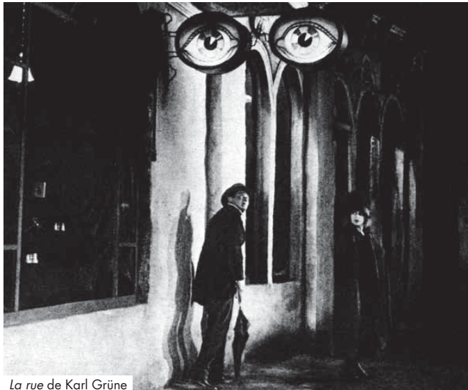
La rue de Karl Grüne

Le cas Image de Ville est quelque peu à part, en marge des habituels festivals cinématographiques régionaux. Car il n'est justement pas, à proprement parler, un festival de cinéma. Et c'est sans doute cela qui, positivement, le distingue des autres manifestations. Image de Ville se sert en effet de l'image — cinématographique, expérimentale, documentaire — dans le seul but de nourrir une réflexion sur le sens de l'espace urbain et de nos rapports à la ville, sans oublier de nous en remémorer régulièrement l'histoire, le passé, l'évolution. Le festival a donc le défaut de ses qualités : aussi sympathique soit-elle, la programmation pêche parfois par son manque d'exigence, alors que les espaces de réflexions ainsi créés se révèlent, eux, passionnants. D'autant que le sujet abordé ici — le festival apporte chaque année un soin particulier au choix de ses thèmes — se pique de réfléchir à la façon dont vit une ville la nuit. Comment l'espace urbain évolue et se transforme, une fois le soleil — et la plupart des habitants — couchés. Sujet qui ravira les noctambules que nous sommes, et qui nous permettra de sortir des clichés éthylo-poético-bohringiennes, d'autant que le cinéma post-70's s'est largement emparé du thème. Evoquons d'emblée l'une des très bonnes idées de cette nouvelle édition : un coup de projecteur sur l'immense Henri Alekan, virtuose de la lumière, chef opérateur de génie, certes très ancré dans une