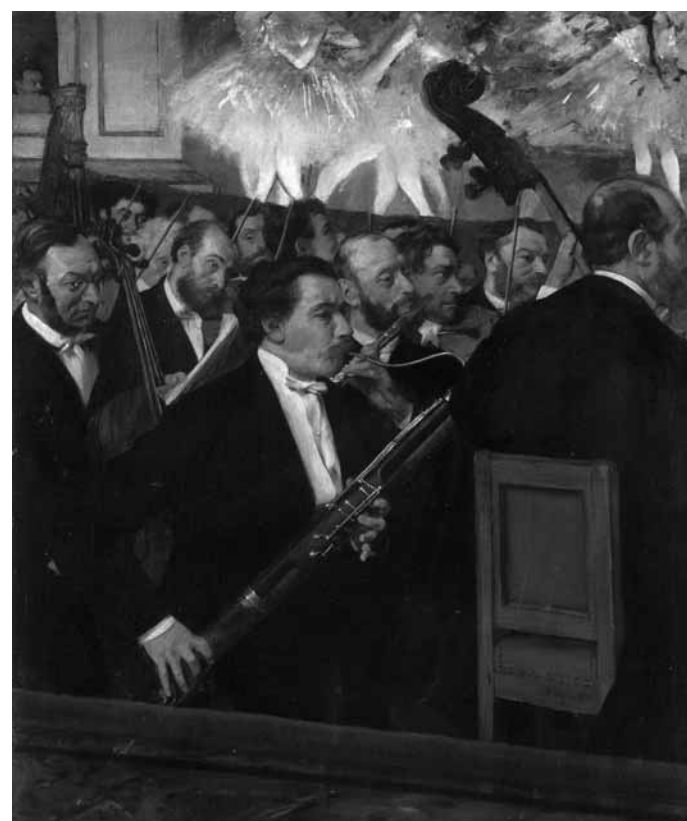
Edgar Degas, L'Orchestre de l'Opéra , vers 1869-1869, Huile sur toile, 56,5 x 46,2cm. Musée d'Orsay, Paris

De la scène au tableau : jusqu'au 3/01 au Musée Cantini (19 rue Grignan, 6 e ). Rens. 0 810 813 813 / www.marseille.fr