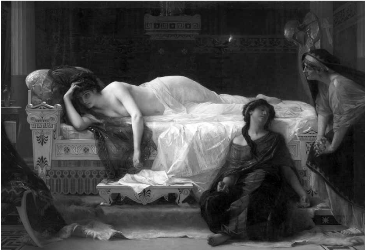
Alexandre Cabanel, Phèdre , 1873. Huile sur toile, 194 x 286 cm. Montpellier, Musée Fabre

Du néoclassicisme de David à l'abstraction du jeu scénique d'Appia, près de 200 œuvres aussi belles que rares (peintures, dessins et maquettes de décors issus d'institutions et de collections prestigieuses du monde entier) sont réunies au musée Cantini pour une expo monumentale et pertinente.