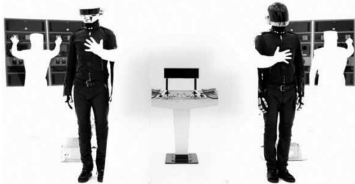
Daft Punk's Electroma de Thomas Bangalter & Guy-Manuel de Homem-Christo

ville (les Très Courts, par exemple), jusqu'à oublier la substantifique moelle d'une fête construite sur son aspect unique ? Simple évolution des règles ou diktat d'un marché désormais construit sur le seul amortissement ? L'intéressé de répondre : « On