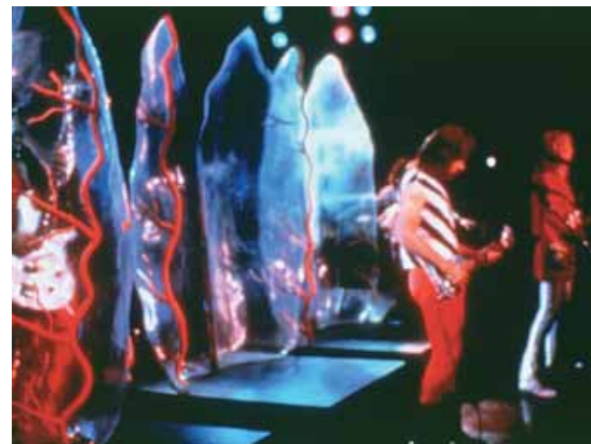
This is Spinal Tap de Rob Reiner

jeunesse — Stones, Bowie et Dylan en tête —, le tout baignant dans l'esprit fort palpable d'un « c'était mieux avant ». L'Institut de l'Image n'échappe pas réellement à la règle, même si la programmation finit par sortir son épingle du jeu, par la présence de deux films absolument incontournables : This is Spinal Tap et One + One . Le premier, miraculeux éclair de génie de la part d'un tâcheron comme Rob Reiner, suit avec force ironie la lente descente aux enfers d'un groupe de hard FM. Tous les clichés du genre — collants moule-boules et guitares zébrées — sont passés à la moulinette dans ce cultissime vrai faux documentaire. Le Godard, quant à lui, redistribue la donne du genre avec brio. Les autres choix sont plus douteux : malgré un regard diablement cultivé, le Last Waltz de Scorsese reste par trop didactique ; quant au Ziggy Stardust de Pennebaker, il s'agit là d'une des dernières dates de la tour-