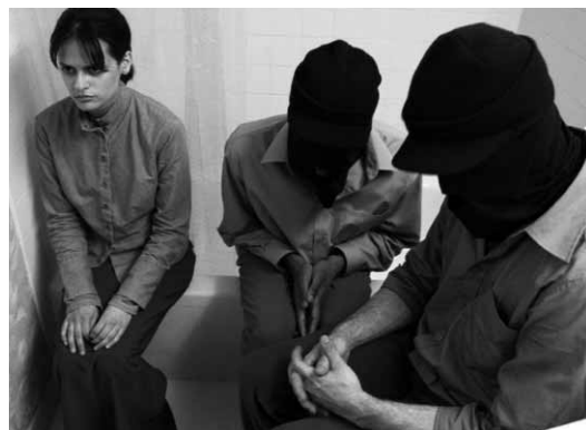
Day Night Day Night de Julia Lokteva

des salles : les programmeurs finissent par s'auto-censurer si un film n'est pas assez porteur. On l'a très bien vu pour Ils ne mourraient pas tous mais tous étaient frappés, qui n'avait qu'une pauvre copie en circulation, que tout le monde ou presque a refusé. Un exemple parmi tant d'autres. Le phénomène est