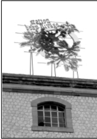
Bettina Samson. Station Beau Rivage